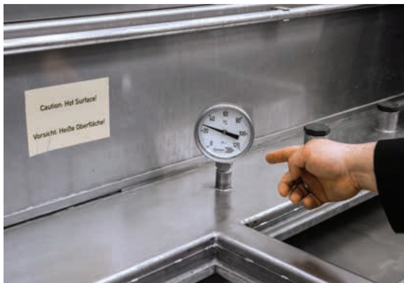
» Temperatura kupke za čišćenje ne premašuje 30 °C.

Novi Henkelov niskotemperaturni sustav za čišćenje Bonderite je potpuno udovoljio navedenim zahtjevima proizvodnog procesa tvrtke SITECO. Alkalna dvokomponentna sredstva za čišćenje možemo primijeniti pri sobnoj temperaturi, pri čemu je zagrijavanje sredstva za čišćenje na uobičajenih 60 °C stvar prošlosti. Radi kombinacije posebnih elemenata i površinskih dodataka, taj novi sustav čišćenja se može primijeniti kao nadomjestak većini postupaka