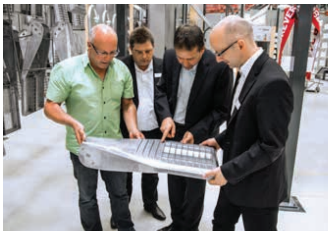
» Kontrola kvalitete.