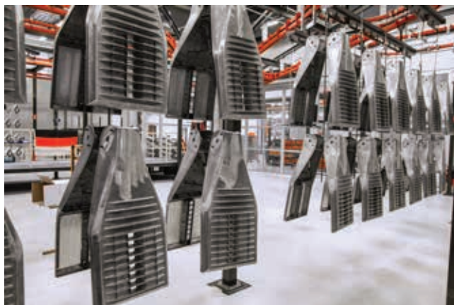
» Alkalni dvokomponentni čistač omogućuje kvalitetno čišćenje – prikazani dijelovi imaju 100-postotnu hidrofilnu površinu.

Snizena temperatura čišćenja je omogućila tvrtki SITECO smanjenje potrošnje energije za 30 posto. Druga prednost je i u hladnim dijelovima, koji dolaze s postupka čišćenja. Oni nemaju utjecaj na daljnje postupke nanošenja boje. Čitava proizvodna linija sada djeluje pri jednakim temperaturama – sve do adhezivnog vodenog sušila. Niske temperature čišćenja također bitno smanjuju gubitak sredstva za čišćenje radi hlapljenja.