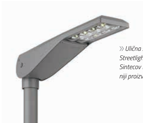
» Ulična svjetiljka Streetlight 10 LED je Sintecov najprodavaniji proizvod.

način hladnog čišćenja isto tako pomaže zaštititi prirodnog okruženja. Manja potrošnja energije, čišćenje bez vodene pare i činjenica, da dodatne kemikalije, kao što je fosforna kiselina, nisu više potrebne, kada ponovo punimo kupku za čišćenje, sve to omogućuje održivu proizvodnju.