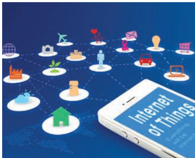
» Internet stvari posvuda: potrošnja za internet IoT će ove godine doseći 651 milijardu eura, a u 2022. godini 874 milijarde.

(CAGR). Tržište običnih, pločastih tableta (eng. slate) će u razdoblju 2018-2022. padati još brže, 5,8 posto godišnje. Pa i ako će se pad usporiti, situacija za tablete najvjerojatnije se neće potpuno poboljšati, radi pritiska omiljenih pametnih telefona, navedenih inovacija u tabletima i produljenog životnog ciklusa tableta.