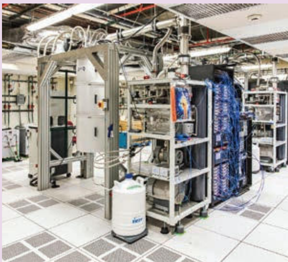
» Odgovori na kompleksne probleme: IBM-ova kvantna računala povezana u oblak

Kvantno računarstvo: Iako je u svojoj ranoj fazi, kvantno računarstvo obećaje, da će naći odgovore na probleme, koji su prekompleksni, da bi bili riješeni s pomoću tradicionalnih računala. Od razvoja kvantnog računarstva najviše će koristiti imati automobilska, financijska, osiguravajuća, farmaceutska i vojna industrija. Direktori informatike bi morali početi učiti, kako će moći primijeniti kvantno računarstvo za rješavanje stvarnih poslovnih problema, predvidivo u 2023. godini ili najkasnije u 2025. godini.