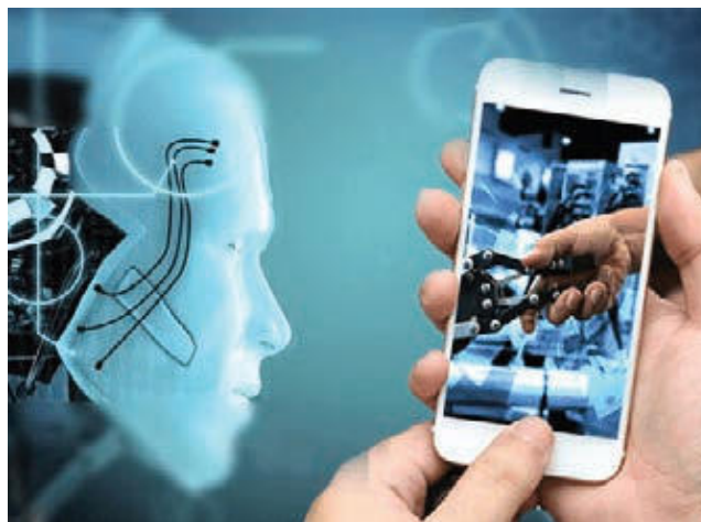
» Pomoć umjetne inteligencije: kroz tri godine će približno 40 posto novih projekata razvoja aplikacija uključivati i AI-developere u timovima.

Tržište proizvoda i usluga Industrije 4.0 će u razdoblju 2017. do 2023. godine rasti prosječno 37 posto godišnje, sa 41 milijarde eura u 2017. godini na 271 milijardu u 2023. godini, procjenjuje u najnovijem istraživanju IoT Analytics, vodeća istraživačka tvrtka na području IoT, M2M i Industrije 4.0. Najave za godine između su bile: 56 milijardi eura prošle godine, 76 milijardi ove godine, 104 milijarde u 2020. godini, 142 milijarde u 2021. godini, 195 milijardi eura u 2022. godini. Približno petina prihoda od Industrije 4.0 dolazi s naslova šest elemenata povezane industrije – strojne opreme, povezujuće opreme, platformi i analitike u oblaku, aplikacija, sigurnosnih proizvoda i rješenja te opreme za integraciju sustava. A približno petina dolazi iz podupornih tehnologija Industriji 4.0 – aditivne proizvodnje (3D-tiskanja), obogaćene i prividne stvarnosti (AR/VR), suradničkih robota, povezanog strojnog vida, dronova i samovozećih vozila (SDV).