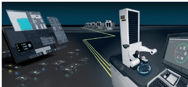
»»venturion« i »pilot 4.0« - simbioza mehanike, strojne i programske opreme

Upravljanje alatima i radnim sredstvima TMS Tool Management