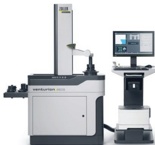
» Nova generacija »venturion« – paradni primjer modularnosti

Najviša kvaliteta, primjena komponenata poznatih robnim marki i pouzdanost su jamstvo za to, da će svi uređaji iz serije »smile« i