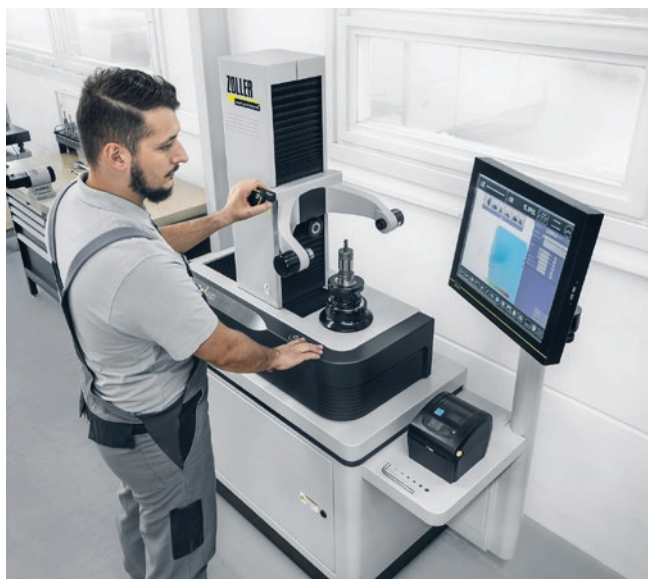
» Uređaj »smile«

Već ulazni model »smileCompact« osvaja visokokvalitetnom osnovnom mehaničkom opremom. Visoko točno vreteno osigurava zahtijevanu točnost (odstupanje od kružnosti iznosi 0,002 mm), a s pneumatskom kočnicom ga je moguće pričvrstiti u željenom položaju. Za rotacijske alate je na raspolaganju pneumatsko indeksiranje u opsegu 4 x 90° – jednostavno i pregledno s integriranom membranskom tipkovnicom.