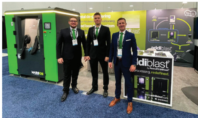
» Ekipa Addiblast na sejmju RAPID & TCT 2022 fair v ZDA.

Ne nazadnje smo se maja letos udeležili velikega sejma v ZDA, to je sejma RAPID+TCT v Detroitu.