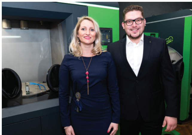
» Ekipa Addiblast na sejmu FORMNEXT 2021 v Nemčiji.

Drži, vendar je to tisto, kar počnemo in kar nas predstavlja. Vedno poskušamo slediti najnovejšemu razvoju kot aktivni deležnik. V tem posebnem primeru smo stvari privedli še korak naprej, saj želimo biti in bomo eden izmed ključnih ali prednostnih razvijalcev in ponudnikov rešitev naknadne obdelave za industrijo aditivne proizvodnje.