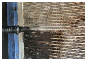
» Čišćenje izmjenjivača topline bez primjene kemijskih sredstava za čišćenje.

S odgovarajućom nadogradnjom, uređaj za čišćenje JetBoy može se primjenjivati i za čišćenje sa suhim ledom. Čestice suhog leda stvaraju se iz kapljevito CO 2 neposredno na pištolju za čišćenje, pri čemu se CO 2 isporučuje u čeličnim bocama. Potpuno novi