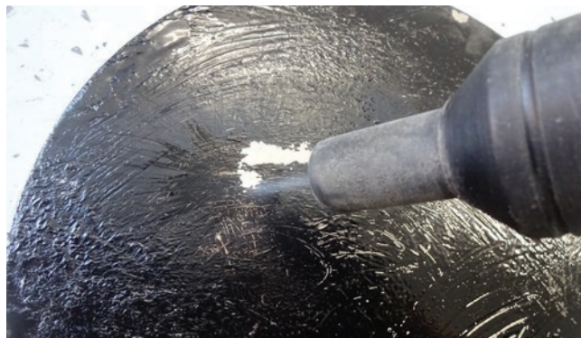
» Uklanjanje površinskog sloja sa suhim ledom.

razvoj tvrtke mycon omogućuje bitno povećanje učinkovitosti čišćenja sa suhim ledom s dodacima.