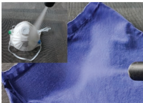
» Čišćenje sa suhim ledom i dodacima.