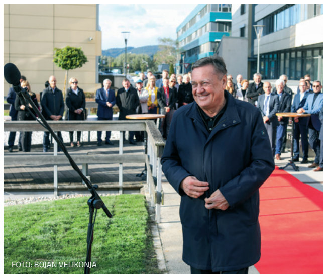
» Župan Mestne občine Ljubljana Zoran Jankovič

družinskem ali drugih, zmaga socialni kapital. Ta je na prvem mestu. Vse drugo je posledica dobrih odnosov, znanja in volje po zmagi. Ko uspeš prepričati sodelavce, da želijo zmagati, si zmagal tudi sam.«