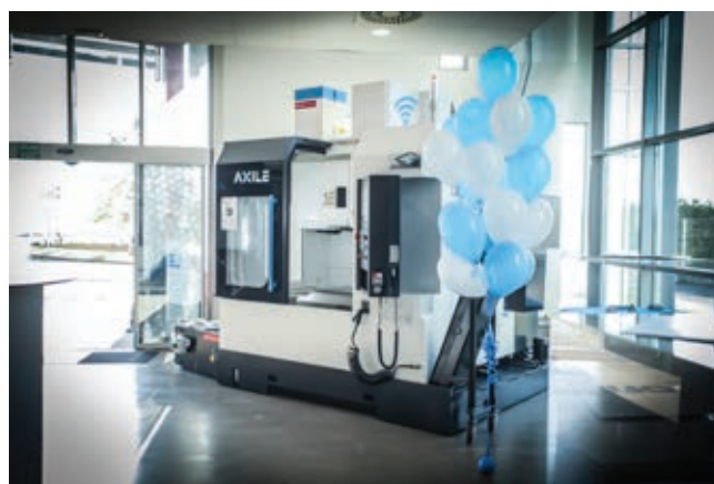
» Stroj dobrodošlice – AXILE V5 na samom je ulazu u izložbeni prostor Microcutova samoborskog sjedišta

Buffalova patentirana tehnologija za automatski nadzor i preciznu kompenzaciju, i ART je usvojio tehnologije koje su dio Industrije 4.0, kako bi se osigurao rad strojeva svih 24 sata uz uštedu energije i visoku produktivnost.