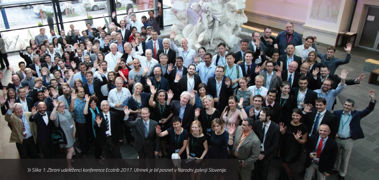
» Slika 1: Zbrani udeleženci konference Ecotrib 2017. Utrinek je bil posnet v Narodni galeriji Slovenije.