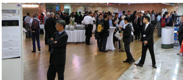
» Slika 2: Čas za kosilo in diskusijo po predavanjih