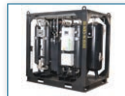
264 Generatorji dušika in kisika