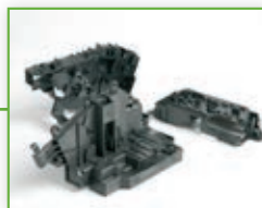
236 MuCell tehnologija