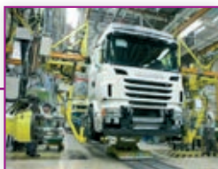
152 Proizvajalec tovornjakov SCANIA je implementiral platformo 3DEXPERIENCE