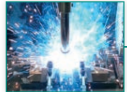
130 Novosti na področju robotskega verjenja