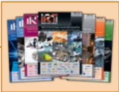
11 IRT3000 v letu 2018: 10 je več in bolje od 6