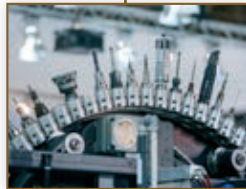
88 METAV 2018: Sejem proizvodnih tehnologij