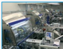
214 automatica 2018: fokus na medicinske in farmacevtske aplikacije